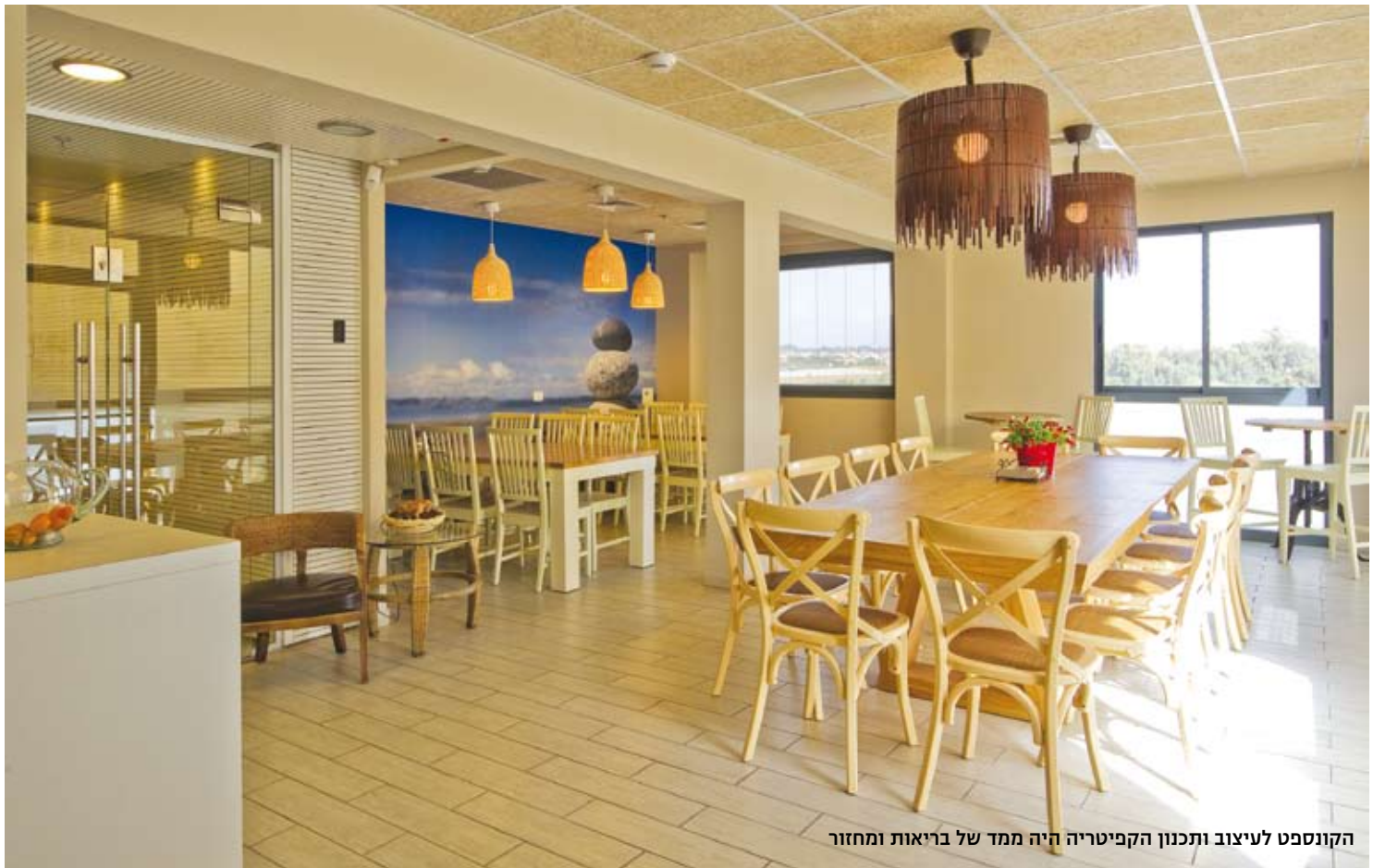
הקונספט לעיצוב ותכנון הקפיטריה היה ממד של בריאות ומחזור

היוצר הרמוניה. גם בחדרי הישיבות יש חשיבות לתאורה: הם תוכננו עם מערכת חשמל חכמה ואופיינו תרחישי תאורה שונים בכדי למצות את כל סוגי התפעול: תאורת לישיחות וידאו, תאורה רקע למצגות, תאורה לישיבה רבת משתתפים ולכנסים. שני חדרי הישיבות זהים בתכנון התקרה. כך, כאשר פותחים את החללים לחלל אחד, קווי התקרה והתאורה מתחברים ויוצרים המשך רציף והגיוני. שימוש בחומרים קלאסיים כגון רצפת שיש כהה במעברים הציבוריים ובלובי הכניסה, רצפת עץ ושילוב חומרים בטכנולוגיה מתקדמת כגון טפט תלת ממדי, שימוש בפרטי גבס מיוחדים לתאורה ועוד – העניק לפרויקט פן אלגנטי ועכשווי. בכניסה למשרדים שולב אימאגי המייצג את החברה ומעניק צבע ודינמיות.