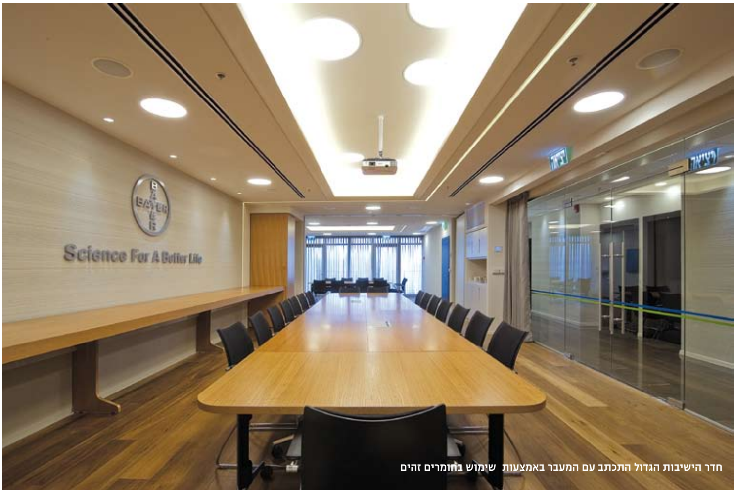
חדר הישיבות הגדול התכתב עם המעבר באמצעות שימוש בחומרים זהים