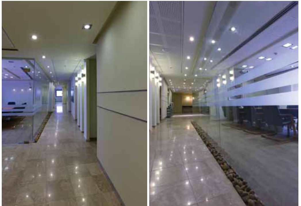
מסדרון ראשי וחדר הישיבות - שפת עיצוב מינימליסטית

כתובת: איזדרכת 11/2, מודיעין טלפון: 08-9701234, 052-2232750 פקס: 08-9701234 naomi50@netvision.net.il