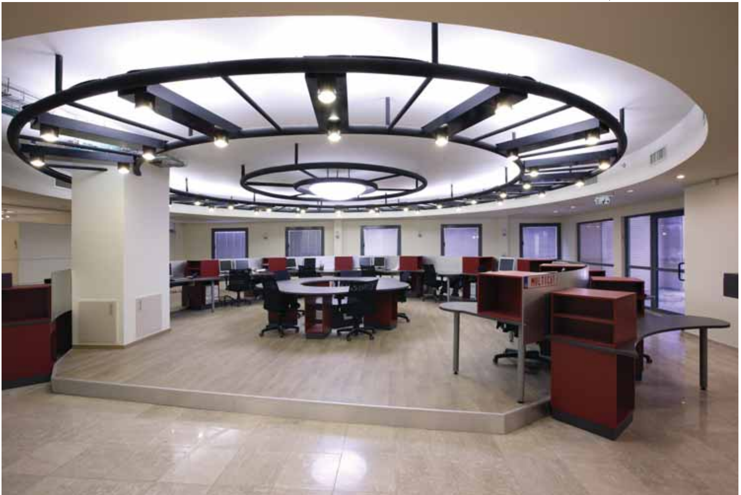
חלל עבודה פתוח שעוצב, באופן לא מסורתי, כאלמנט מעגלי

"נעמי שחר - אדריכלות פנים" תכנון פנים: אדר' פנים נעמי שחר