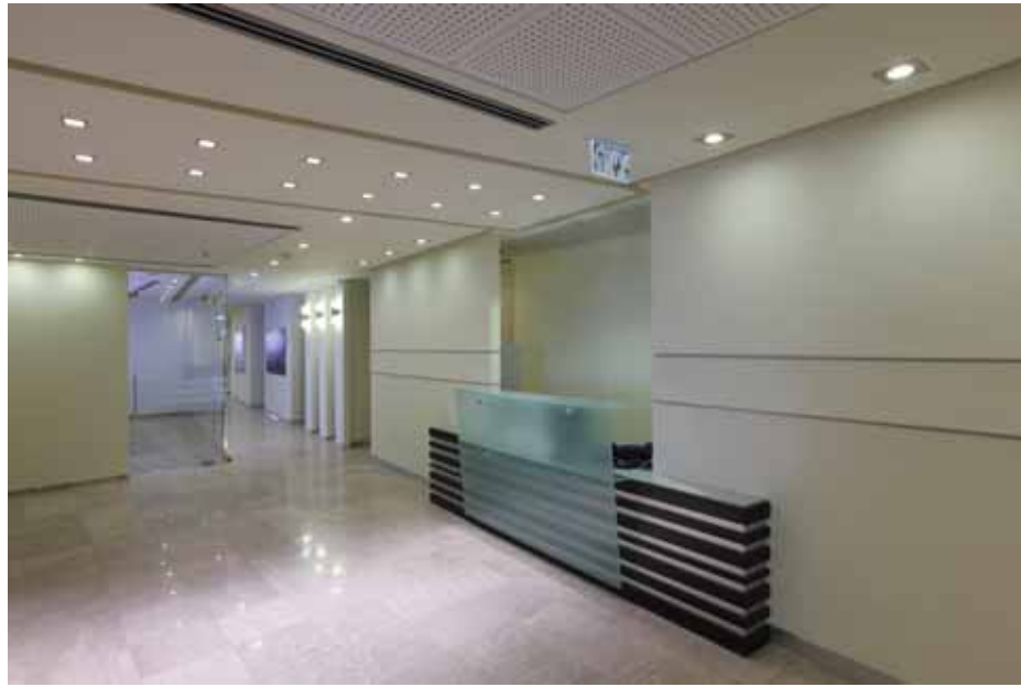
מבט מלובי הכניסה למסדרון הראשי